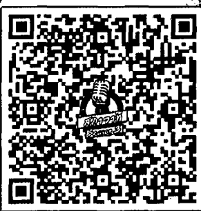
ดาวน์โหลดใบสมัครและกติกาที่นี่

ชิงโล่รางวัลและเกียรติบัตรเกียรติยศ จาก ประธานสภาผู้แทนราษฎร